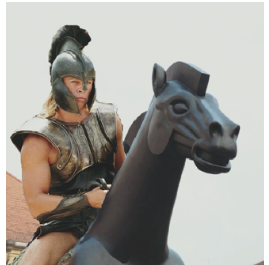
Nebude to trvat dlouho a do Brna dorazí i Brad Pitt.