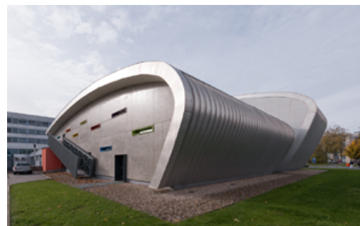
Foto: Výzkumné a výukové centrum Lékařské fakulty UK v Hradci Králové Zdroj: Czech Film Commission