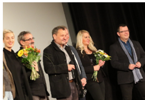
Foto: Premiéra filmu Kvarteto