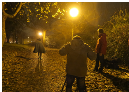
Foto: Z natáčení dokumentu Poslední oběť .