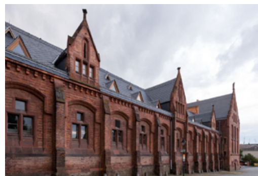
Foto: Červený zámek v Hradci nad Moravicí

Zlín Film Office zorganizovala sérii workshopů k možnostem finanční podpory při natáčení ve Zlínském kraji, na které v říjnu dorazilo více než 80 filmařů.