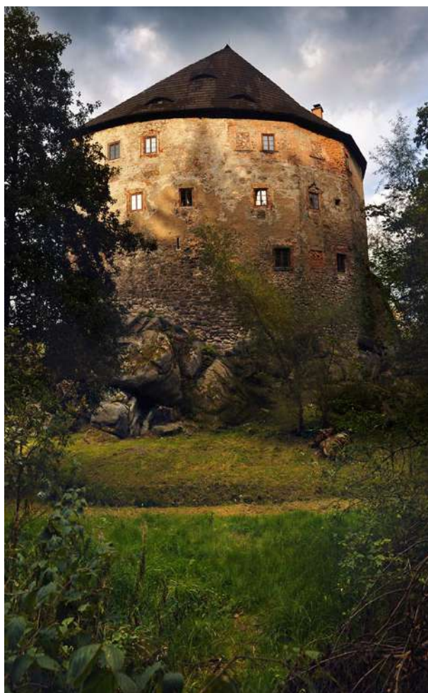
Hrad Vildštejn