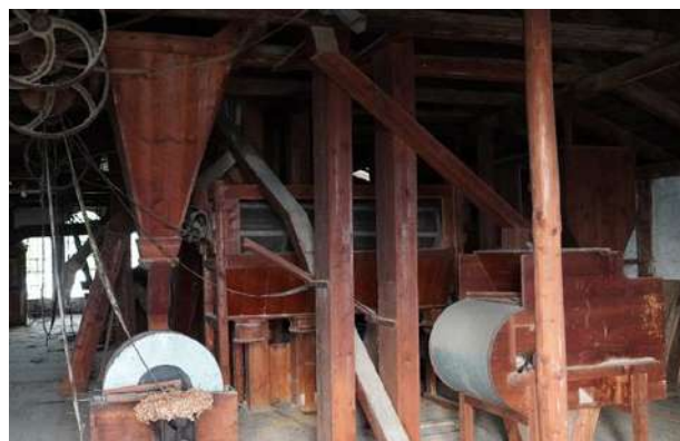
Starý mlýn ve Velké Bystřici