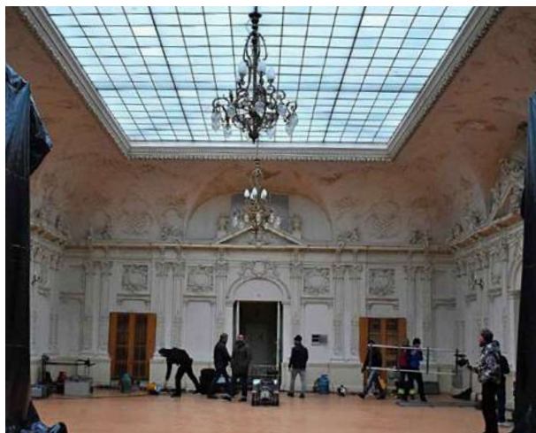
Léčebna Miramonte

Hledáte-li lokace nebo potřebujete-li radu týkající se natáčení v regionu, můžete se obrátit na Petra Židlického , který má na starosti Filmovou kancelář Karlovarského kraje ( zidlicky@zivykraj.cz , +420 736 650 129).