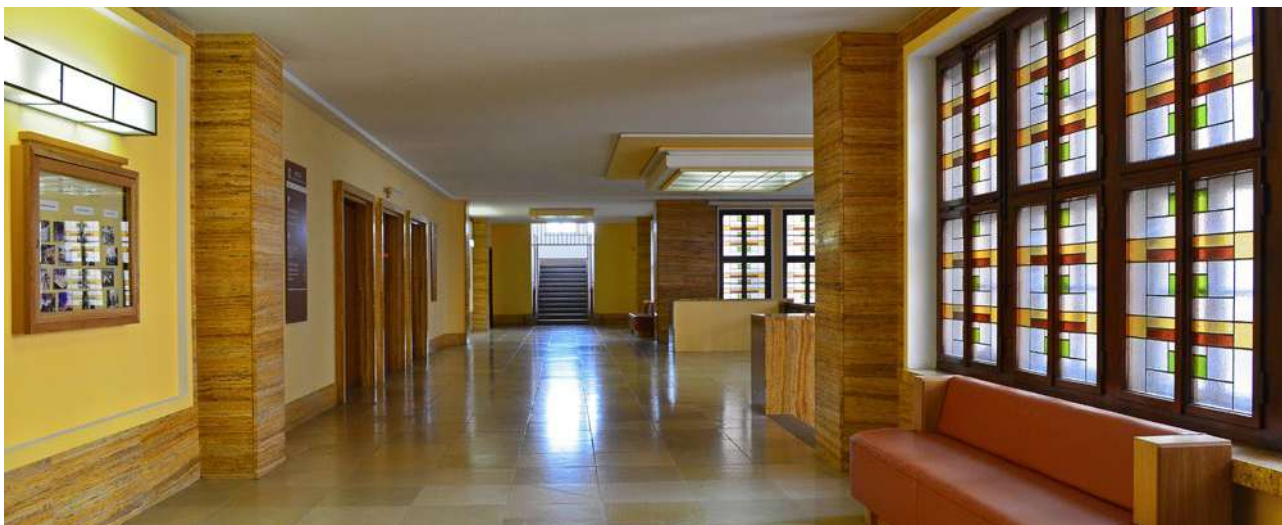
Jablonec nad Nisou, Nová radnice

Přímo ve městě najdete tzv. Jablonecké moře – soustavu 3 na sebe navazujících vodních nádrží Mšeno. Je tu Muzeum skla a bižuterie s výraznou atypickou skleněnou přístavbou ve tvaru krystalu i řada skláren. Jednou z dominant Jablonce nad Nisou je také rozhledna Petřín.