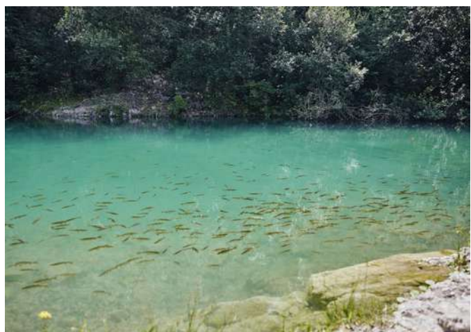
Kurovický lom

Vstup do Kurovického lomu v době oficiální sezony je povolen od dubna do září, po domluvě je návštěva možná i mimo sezónu. Parkoviště se nachází 400 m od lomu, ale je možné vyjednat jednorázovou výjimku například kvůli navedení techniky.