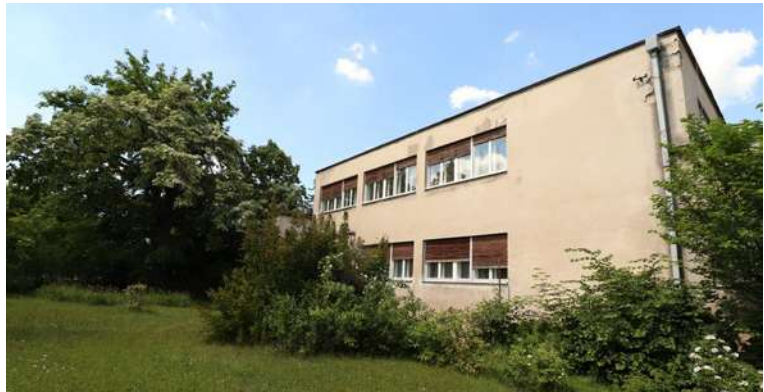
Budilova vila, Kolín

Filmová kancelář by ráda upozornila filmaře na funkcionalistickou Budilovu vilu v Kolíně , kterou pro ředitele kolínské elektrárny Václava Budila navrhl architekt Jaroslav Frágner . Vila je v původním stavu s několika moderními zásahy, které jsou majitelé naklonění natáčení ochotni na žádost produkce odstranit. V pracovně se dokonce dochoval původní nábytek.