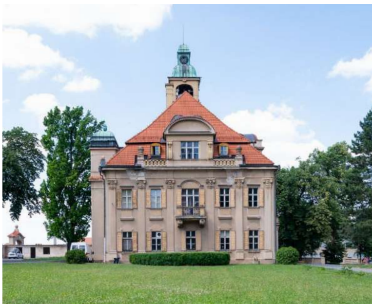
Zámek Hrochův Týnec