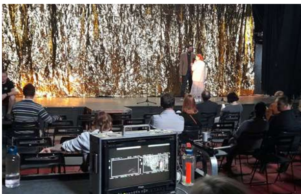
Olomoucký koncertní S-klub

Lokací, která se nyní nově otevírá filmařům, je Starý mlýn ve Velké Bystřici . Byl vyobrazen už na mapách z poloviny 18. století a zděná mlýnice se dochovala bez větších přestaveb s původním vybavením.