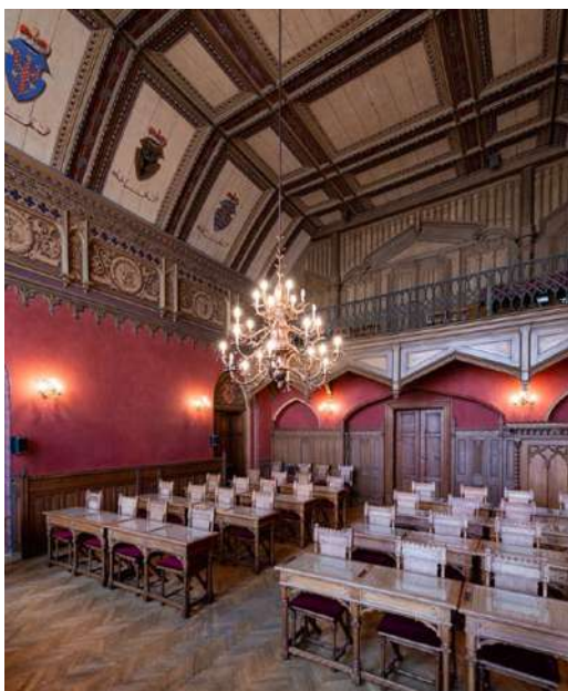
Novogotická radnice v Novém Bydžově

Pozornost filmařů v Pardubickém kraji si zaslouží zámek Hrochův Týnec , který byl postaven v roce 1705 jako letohrádek premonstrátů. Kolem budovy se rozkládá rozlehlý zámecký park v jehož areálu je také letní kino.